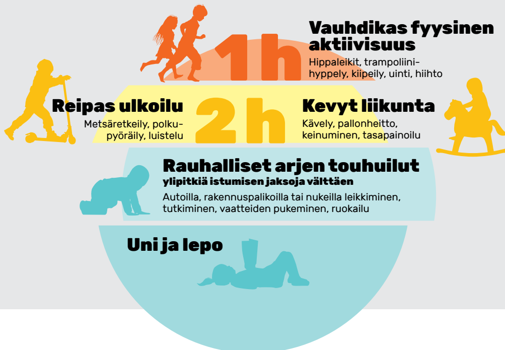
Kuvio 2. Suositeltava fyysinen aktiivisuus koostuu päivän mittaan kuormittavuudeltaan erilaisista arjen touhuista.

Vähintään kolme tuntia liikkumista joka päivä