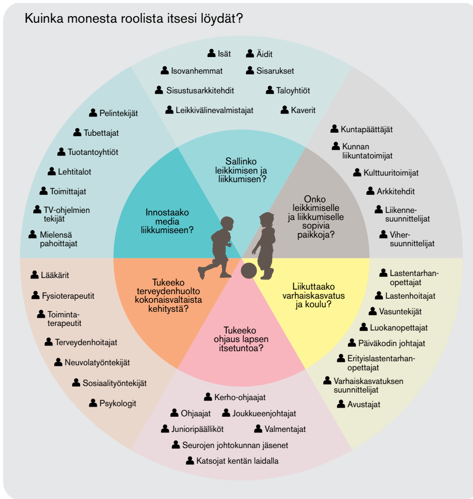
Kuvio 7. Koko kylä liikuttaa (Mukaillen 10 teesiä ja 100 lupaus. Manifesti lasten ja nuorten liikkumisesta.)