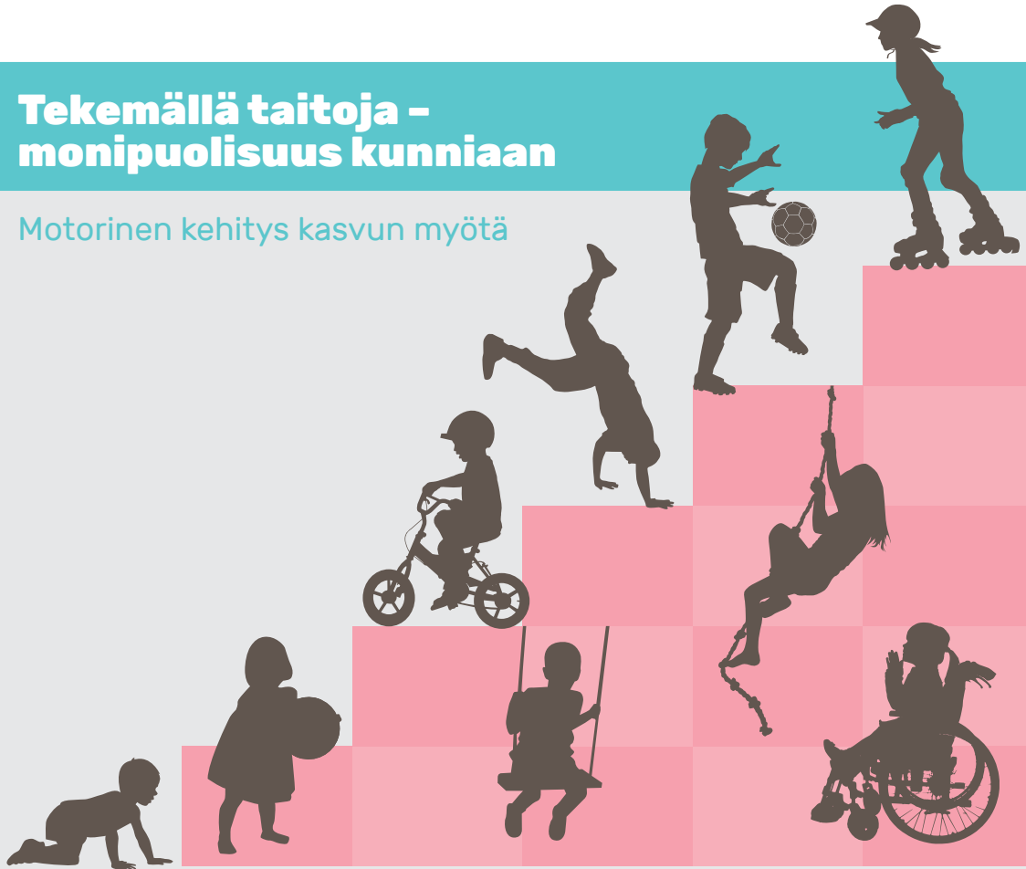
Kuvio 3. Motoriset taidot kehittyvät kasvun sekä monipuolisen leikin, liikunnan ja sinnikkään harjoittelun myötä.