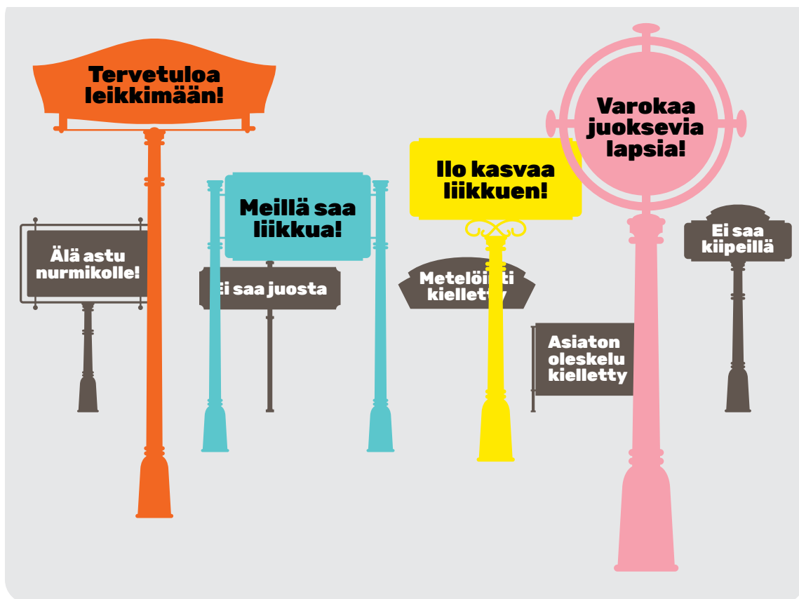
Kuvio 6. Ovatko kaikki kiellot aina tarpeen?