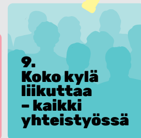
Kuvio 1. Lasten fyysinen aktiivisuus on iloa, leikkiä ja yhdessä tekemistä

9. Koko kylä liikuttaa - kaikki yhteistyössä